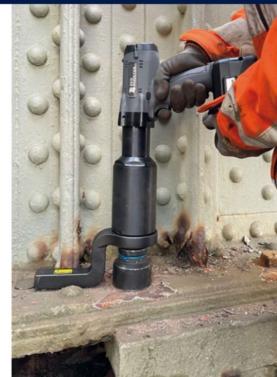
Lösen von korrodierten Schrauben für die Bauindustrie.

Es ist eine Vielzahl von Reaktionsstangen und Halterungen erhältlich, aber wenn Sie eine maßgeschneiderte Reaktionsstange benötigen, können Sie die 3D-CAD-Zeichnungen mit uns teilen.