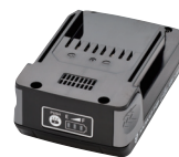
Batterie 18V 2 Ah (BPL-1820)